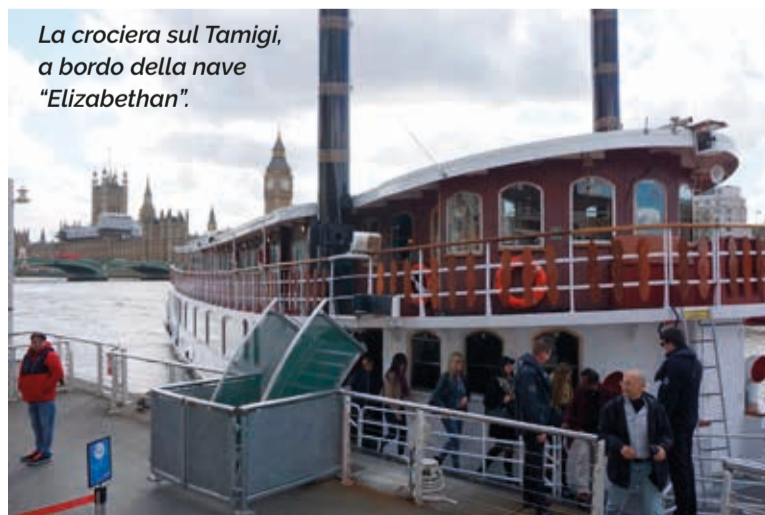
La crociera sul Tamigi, a bordo della nave "Elizabethan".