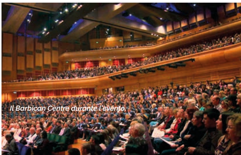
Il Barbican Centre durante l'evento.

"Elizabethan", la stessa nave utilizzata dalla famiglia della Principessa Kate Middleton durante il Diamond Jubilee - un evento storico con oltre 1.000 navi. Dal Cocktail Party presso la storica Gagliardi Gallery alla visita al Museum of London (Barbican Centre) con la mostra "Fire! Fire!" che racconta il grande incendio del 1666, gli invitati hanno trascorso una settimana intensa tra arte, storia e cultura.